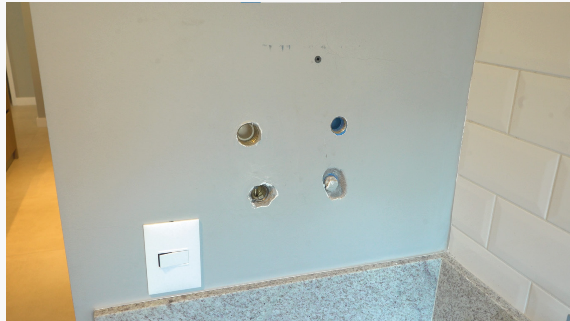
Imagem 20: Local que receberá instalação

O primeiro passo é verificar as condições do local da instalação, com atenção à exaustão e ventilação. Os locais onde serão posicionados os pontos de água fria, gás e água quente também devem receber atenção especial. Verifique se todos os acessórios e ferramentas atendem a necessidade do aquecedor em função do gás escolhido, seja o GN (Gás Natural) ou GLP (Gás Liquefeito de Petróleo).