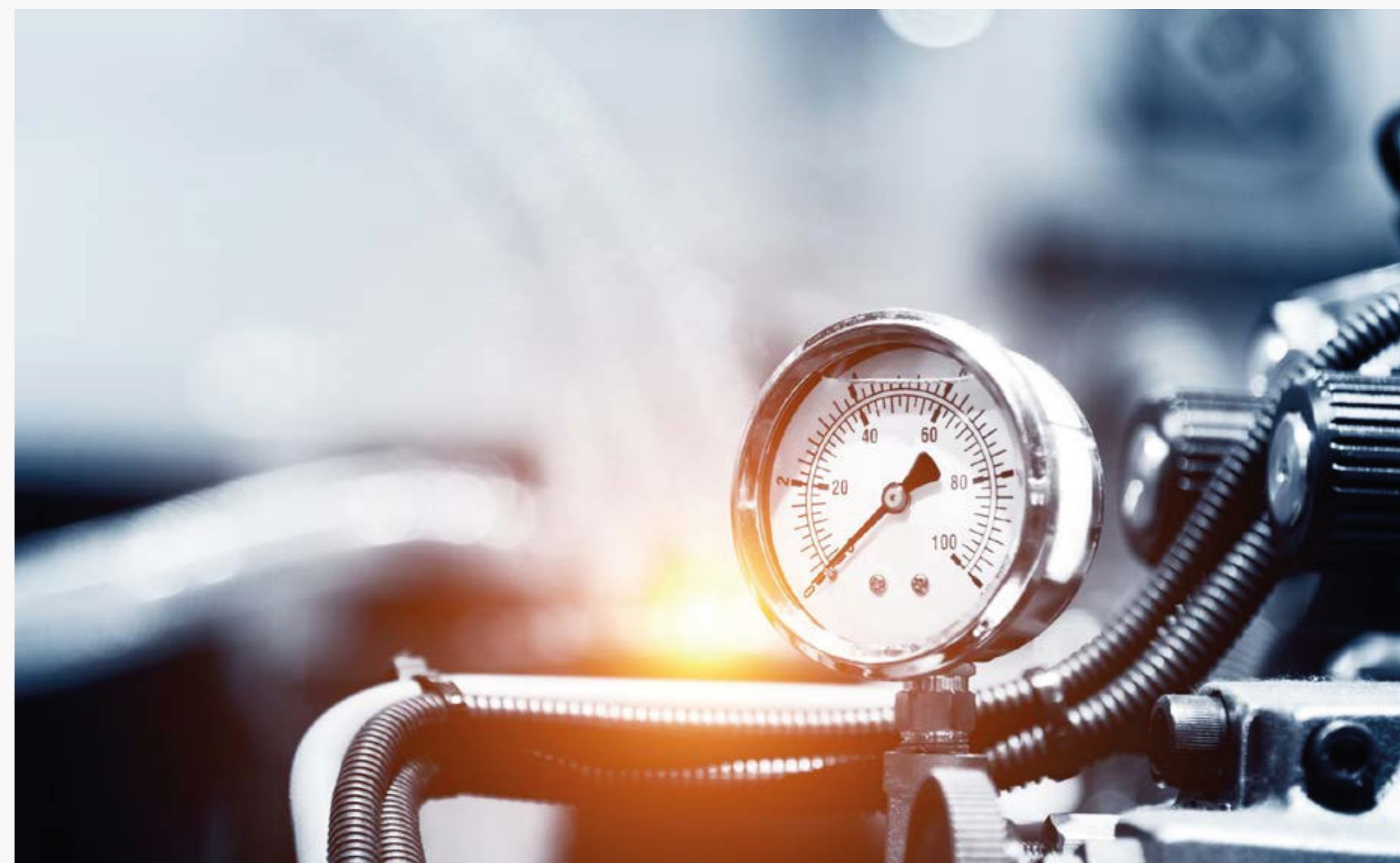
Imagem 14: Medidor de controle de vazão de gás

É necessário calcular a quantidade de consumo que a residência ou edifício terá, determinando-se, assim, valores como vazão e pressão do sistema, das válvulas reguladoras e outros componentes. Deve-se, também, proporcionar um espaço para que haja armazenamento adequado das baterias de gás, no caso de GLP, e de medidores de consumo, para ambos os tipos de gás.