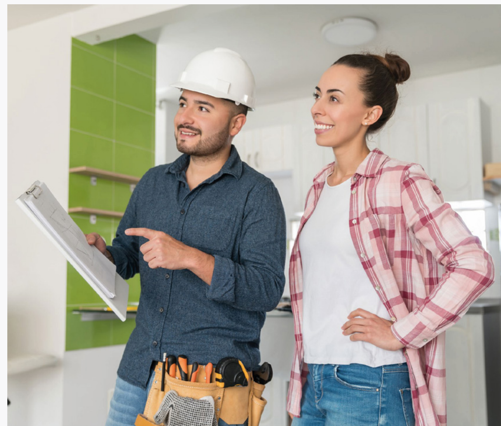
Imagem 19: Profissional de instalação de aparelhos a gás

Não diferente de uma instalação de um Chuveiro Elétrico, ou de um Ar-Condicionado, por exemplo, a instalação de aparelhos a gás deve ser sempre realizada por profissionais devidamente qualificados, sob a supervisão de profissional habilitado, o que é uma determinação da norma ABNT NBR 13103.