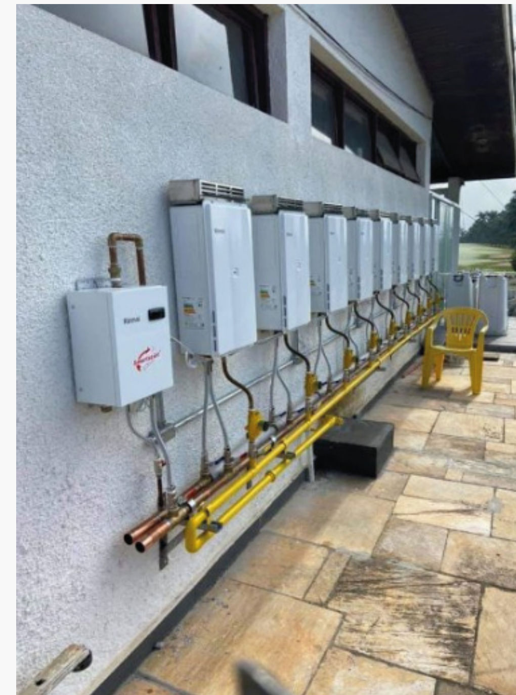
Imagem 9: Sistema a gás instalado

Comprovado em estudos, sistemas de aquecimento de água em construções novas possuem vantagem ao instalar o sistema a gás como alternativa, já que o aumento de potência da rede elétrica para suportar o uso simultâneo de sistemas elétricos de aquecimento de água costuma resultar em investimento de infraestrutura maior que a instalação do sistema de aquecimento a gás. Isso significa que em edifícios de muitos andares e/ou muitos apartamentos por andar, e condomínios com múltiplas torres a infraestrutura para aquecimento a gás é mais vantajosa do ponto de vista construtivo.