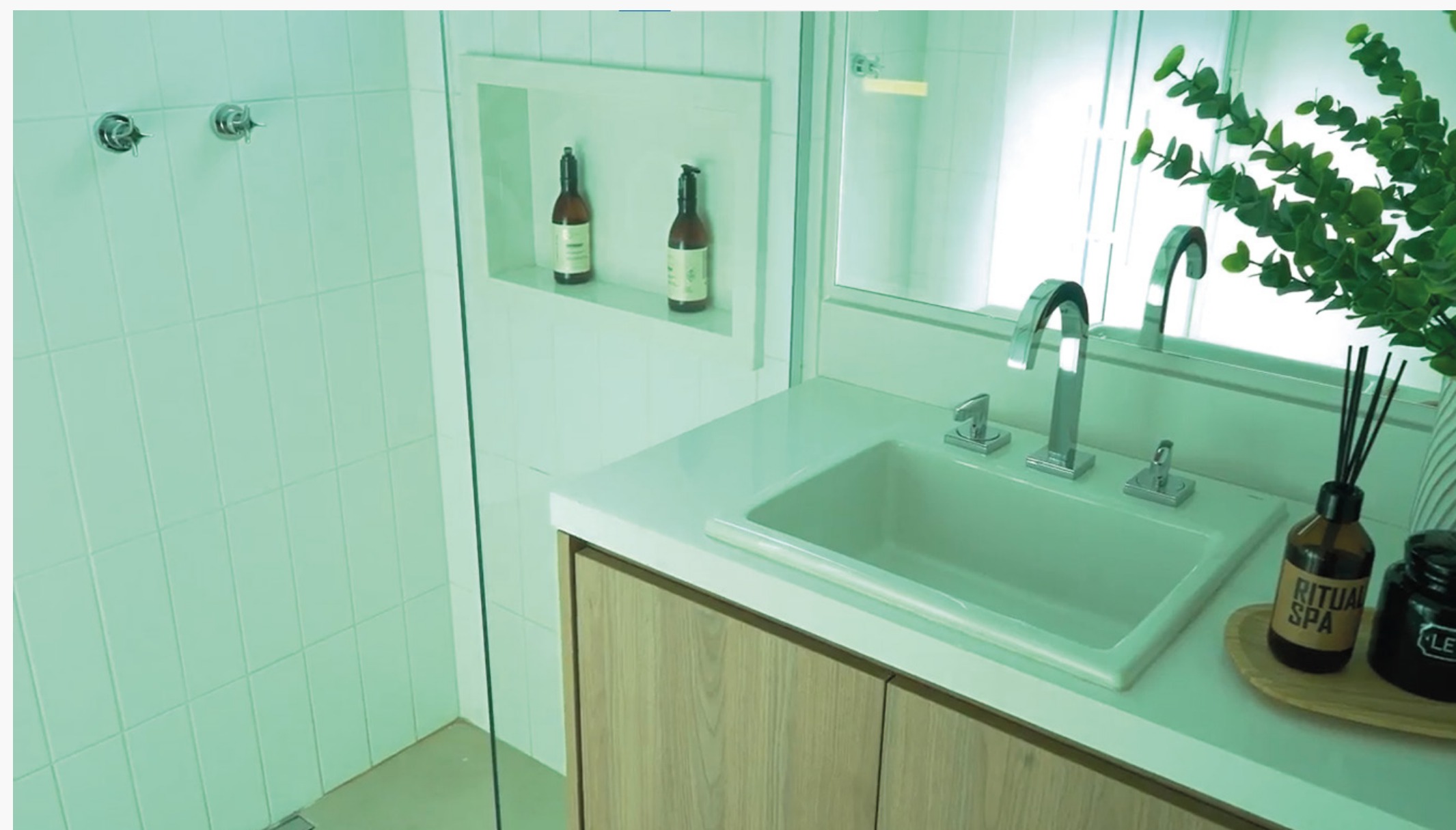
Imagem 17: Ponto de consumo para saída da água aquecida

Em terceiro, temos a água quente, que é a água que sairá aquecida do aparelho e chegará ao ponto de consumo.