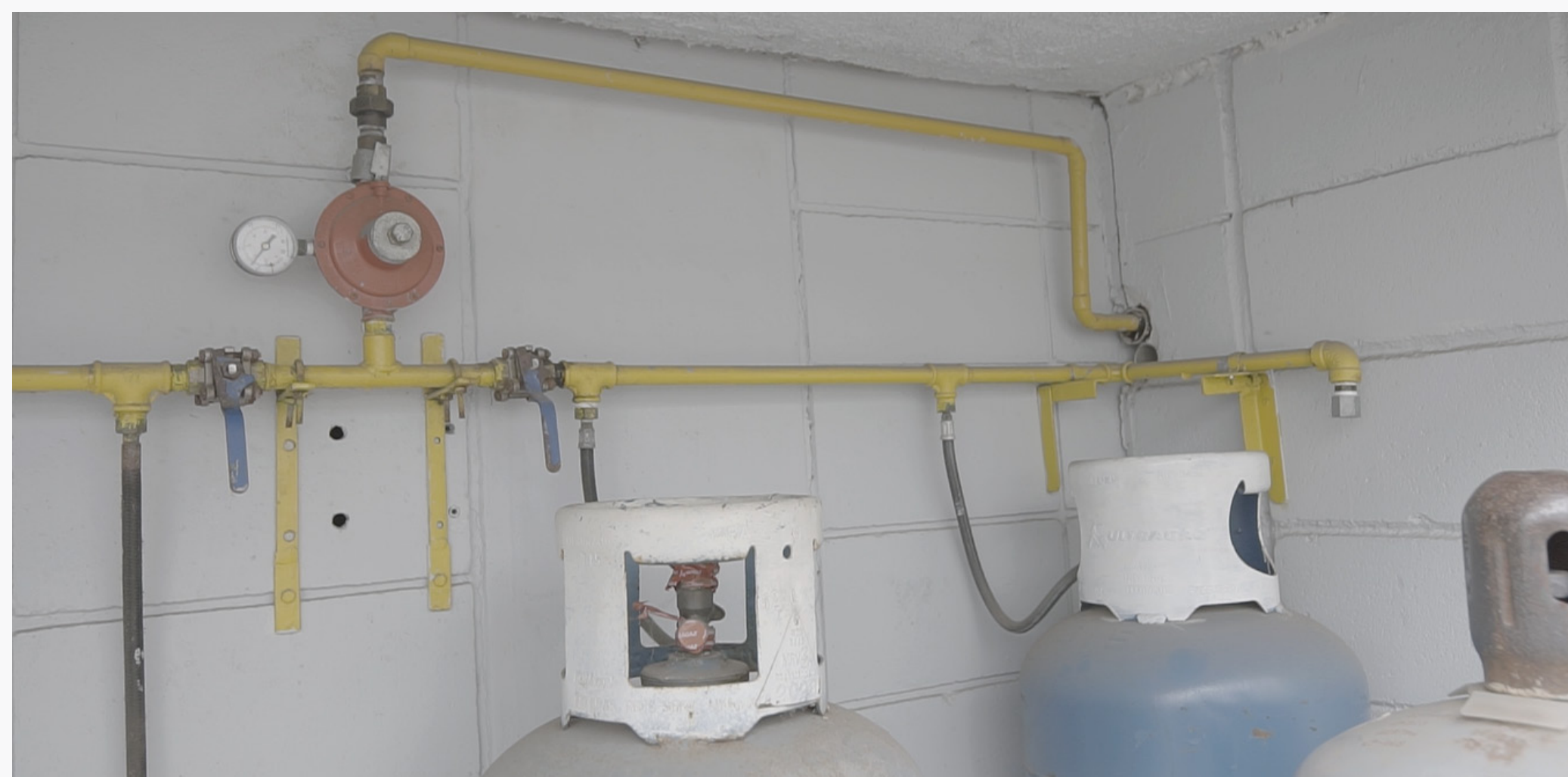
Imagem 10: Gás Liquefeito do Petróleo

Referências normativas: os requisitos, componentes e recomendações de dimensionamento podem ser verificados nas normas ABNT NBR 15526 - Redes de distribuição interna para gases combustíveis em instalações residenciais e comerciais — Projeto e execução; NBR 15358 - Redes de distribuição interna para gases combustíveis em instalações de uso não residencial de até 400 kPa — Projeto e execução e NBR 13523 - Central de gás liquefeito de petróleo - GLP.