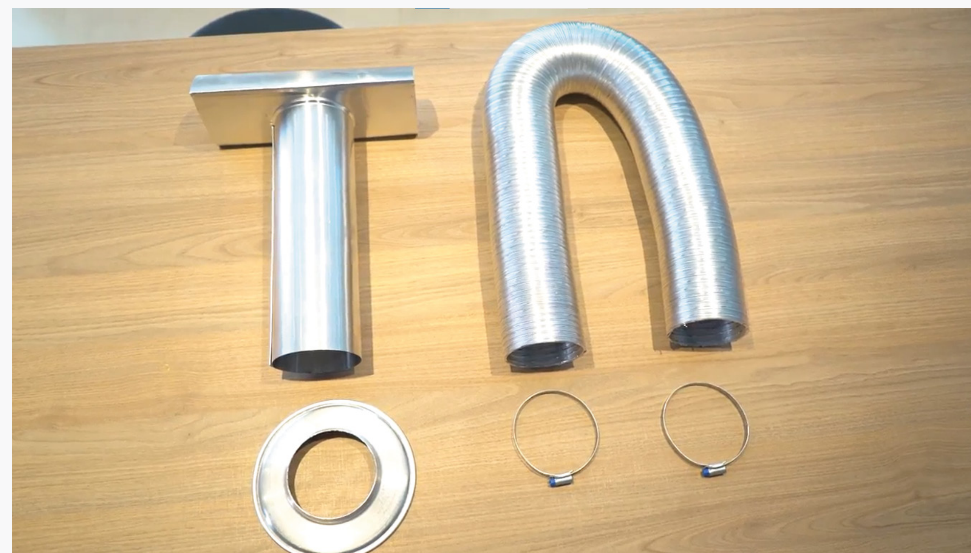
Imagem 16: Duto, terminal, aro de arremate e abraçadeiras

Em segundo, o duto, já que instalações internas precisam de dutos para conduzir os gases ao terminal sem vazamentos para o ambiente ou outros locais da casa.