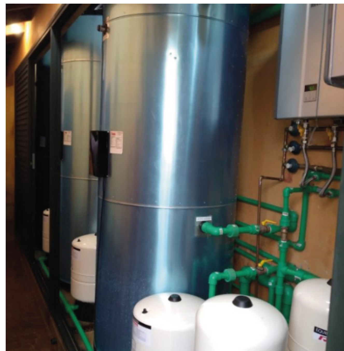
Imagem 11: Sistema de acumulação

O sistema por acumulação proporciona alta vazão simultânea, mas depende de um tempo de recuperação após a água ser consumida, enquanto o sistema por passagem pode atender a demanda de forma instantânea, mas necessita de uma infraestrutura de fornecimento de gás capaz de atender o consumo dos aquecedores em potência máxima neste pico. É importante salientar também que nos sistemas por acumulação o consumo de gás mensal pode ser superior, tendo em vista a necessidade de manter o reservatório constantemente aquecido.