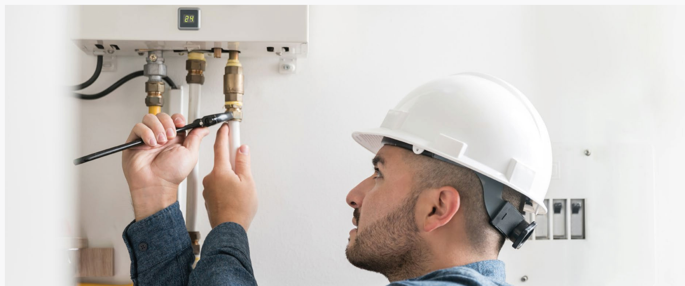
Imagem 4: Técnico fazendo a instalação do sistema de aquecimento

A versatilidade, como a grande variedade de sistemas de aquecimento, o consumidor pode escolher aquela que melhor se adapta às suas condições, às da residência ou edifício. A maioria dos sistemas contam com dispositivos de segurança para prevenir acidentes e/ou possíveis vazamentos, quando bem instalados e sob devida manutenção.