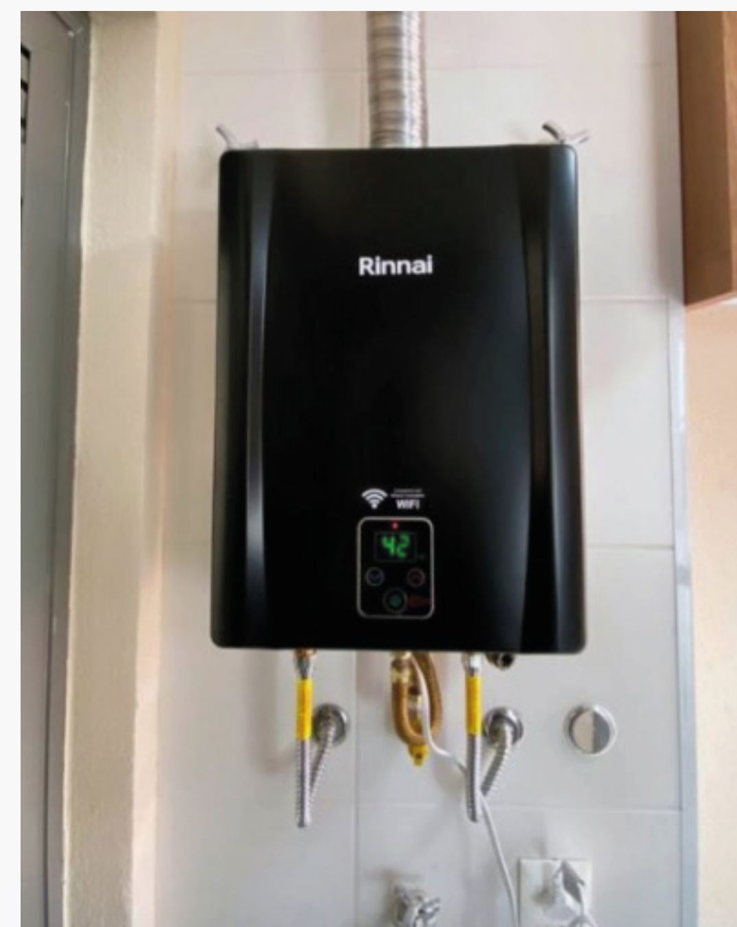
Imagem 12: Sistema de aquecimento de passagem

Referência normativa: os diversos tipos de sistema, componentes e recomendações de dimensionamento podem ser verificados na norma ABNT NBR 16057 - Sistema de aquecimento de água a gás (S.A.A.G.) — Projeto e instalação