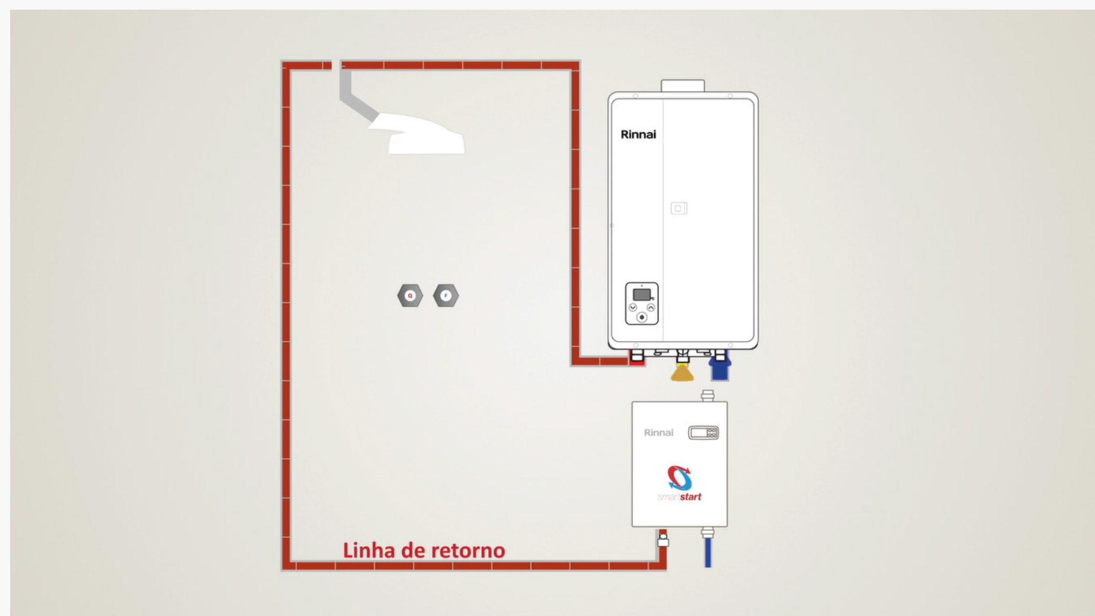
Imagem 13: Sistema de recirculação para evitar desperdícios

O sistema de aquecimento de água a gás é econômico, como observado, mas o consumidor precisa estar atento para extrair ao máximo este potencial de economia. Para isso, as instalações devem sempre ser feitas de maneira correta, respeitando as normas, com manutenção periódica e utilizando produtos de qualidade.