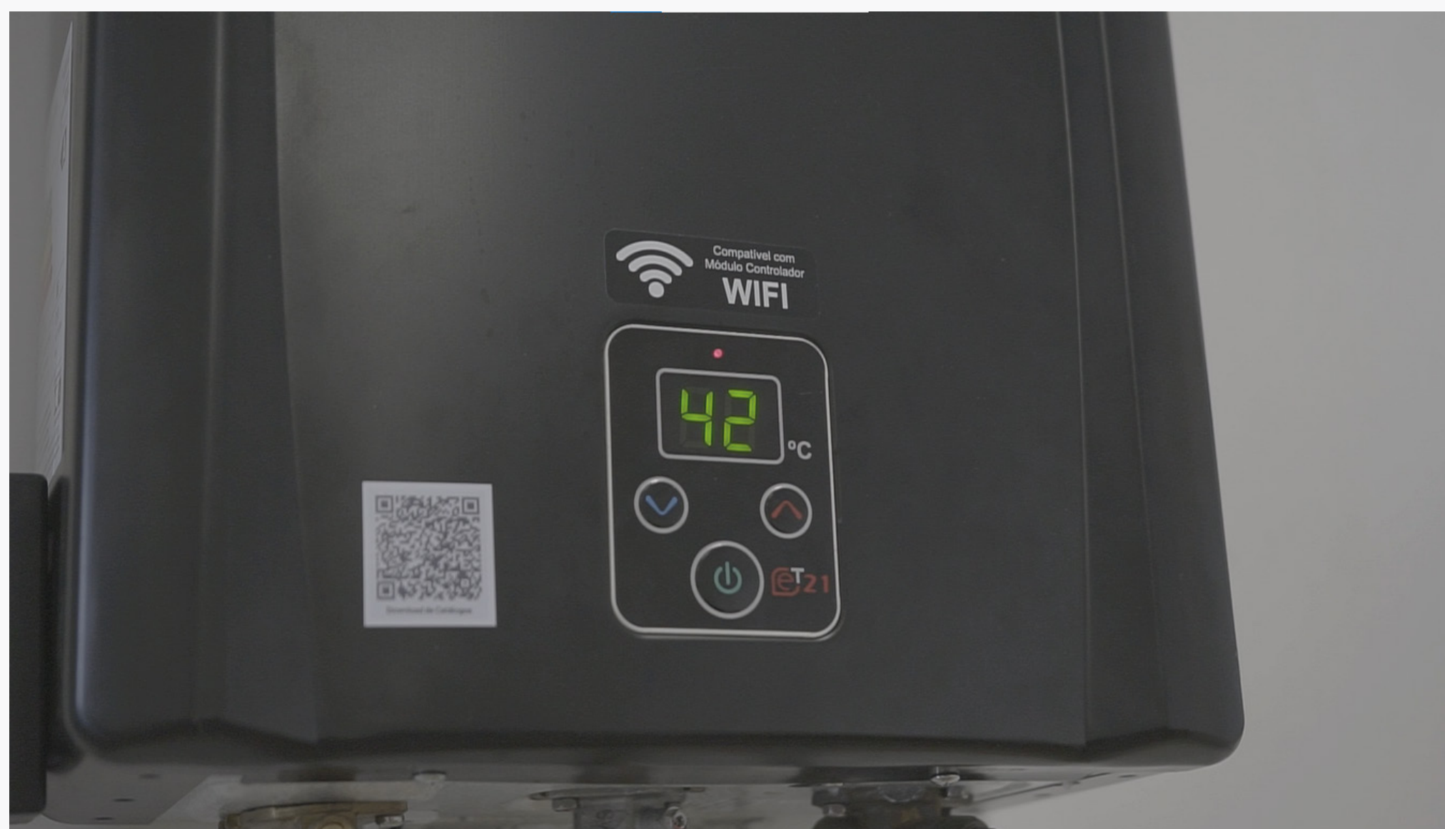
Imagem 8: Controle de temperatura do sistema

Ainda há a possibilidade de combinar certos sistemas e obter o benefício de cada um deles, gerando o sistema híbrido (trabalhando em conjunto com sistemas termossolares e/ou de energia elétrica), buscando obter o máximo das vantagens de cada sistema.