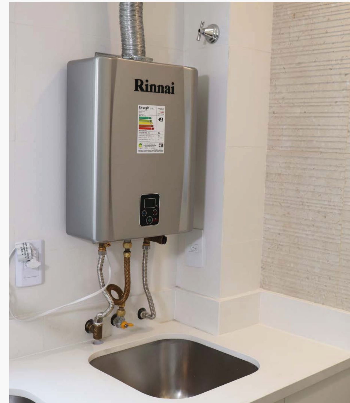
Imagem 7: Sistema de aquecimento gás

A precisão do ajuste de pressão de água e temperatura é apenas um dos pontos principais de destaque do uso destes sistemas. Quem opta pelo sistema a gás obtém dele sua versatilidade, já que os sistemas de aquecimento de água a gás (S.A.A.G.) podem ser do tipo instantâneo, que aquece a água à medida que ela passa pelo aquecedor quando um ponto de consumo é aberto, ou também podem ser do tipo acumulação. Além disso, os sistemas podem ser utilizados como centrais individuais (sistemas que atendem todos os pontos de consumo de uma unidade habitacional) ou centrais coletivas (sistemas que atendem diversas unidades habitacionais), excelentes para apartamentos.