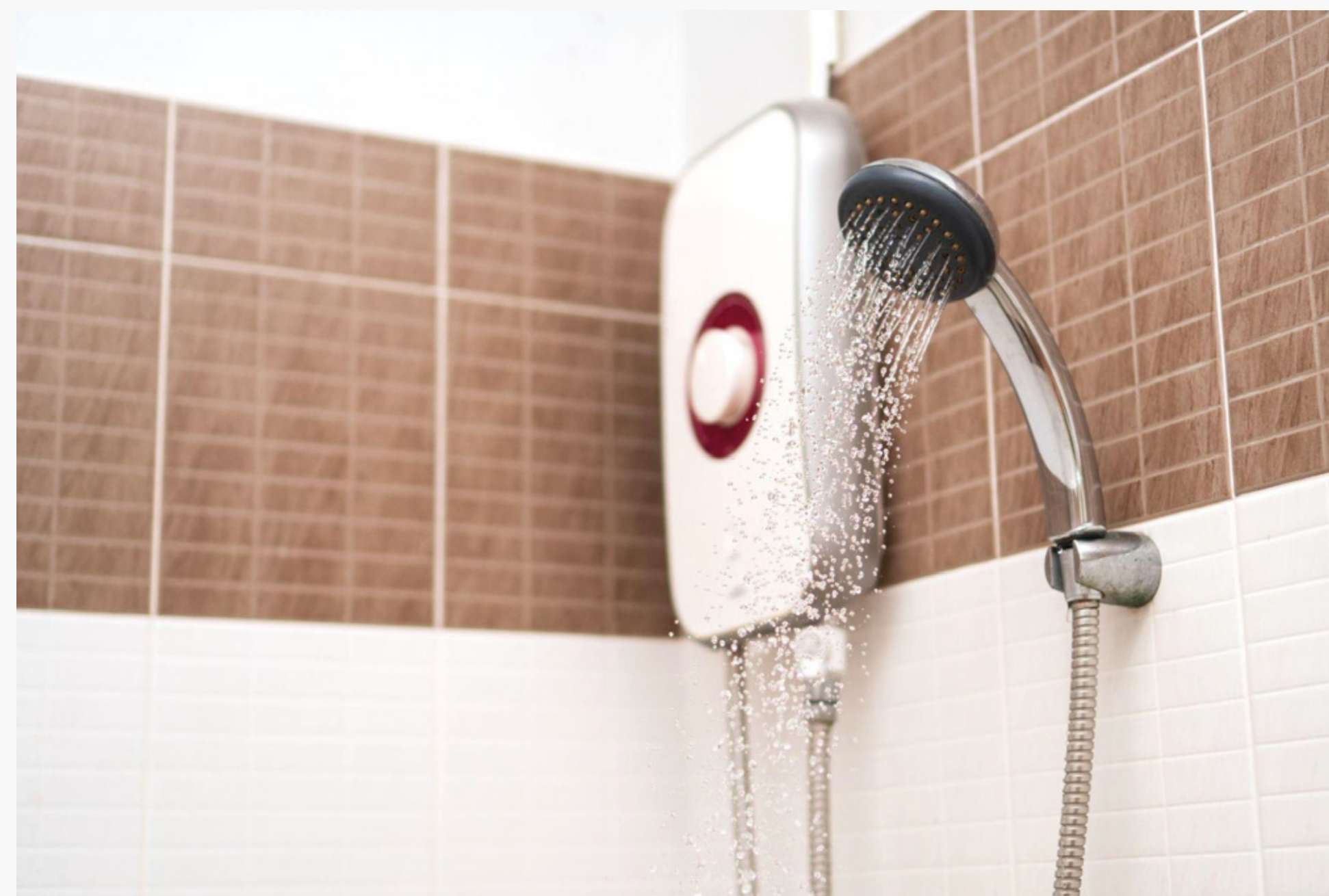
Imagem 6: Chuveiro com sistema de aquecimento elétrico

Há também o sistema elétrico, que é o mais utilizado no Brasil e é onde a energia é retirada da rede e utilizada por uma resistência elétrica para aquecer a água. O sistema mais conhecido é onde este processo é realizado no próprio chuveiro, logo antes de chegar ao consumidor. Existem também sistemas elétricos de acumulação, onde a água é armazenada em um reservatório.