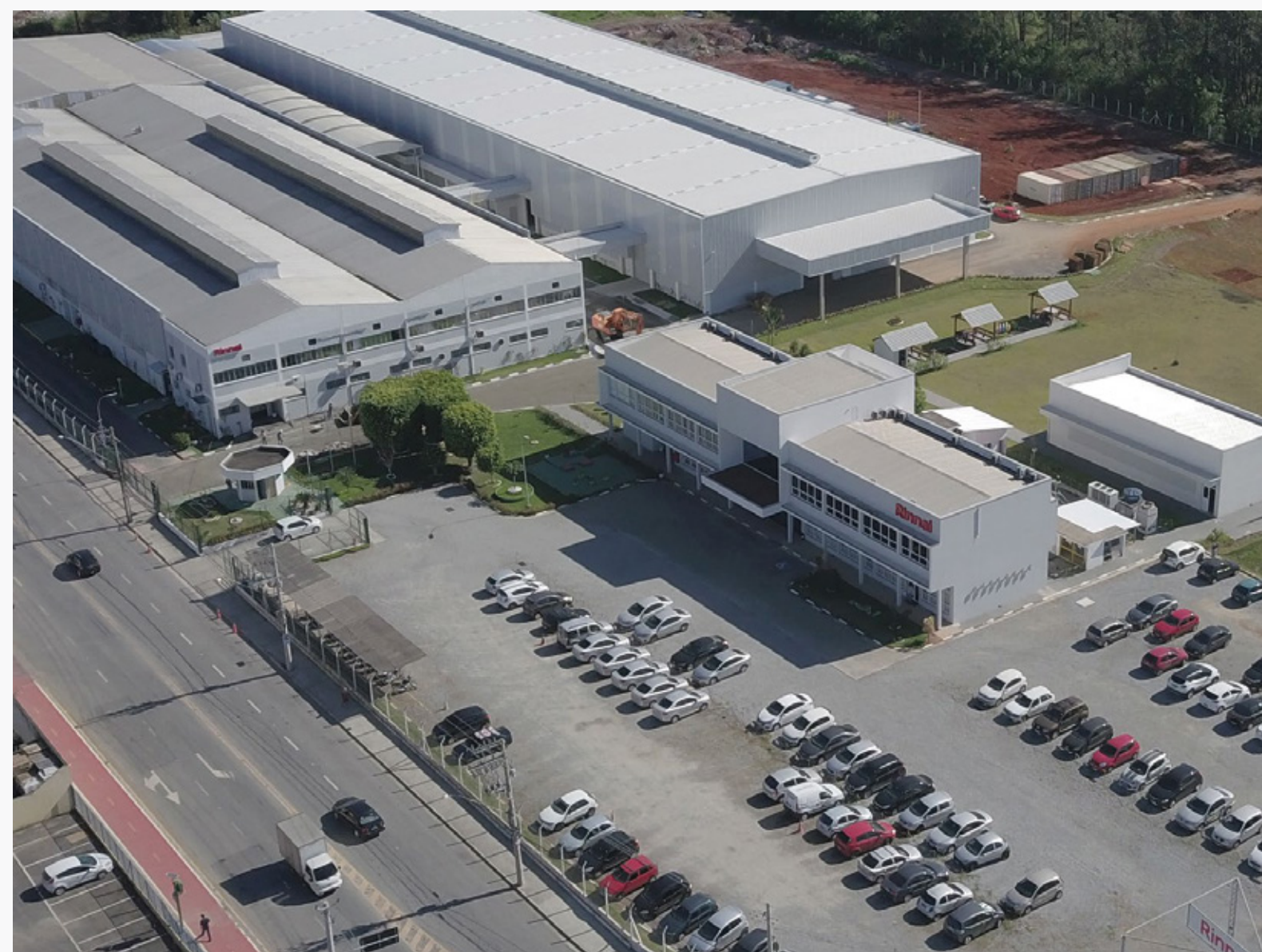
Imagem 2: Sede da empresa Rinnai® em Mogi das Cruzes/SP

A Rinnai® foi fundada em 1920, no Japão, e trouxe sua tecnologia e inovação para o Brasil em 1975. A Rinnai® Brasil está sediada na cidade de Mogi das Cruzes/SP, onde possui uma moderna planta industrial, preparada para produzir uma diversificada linha de produtos e componentes.