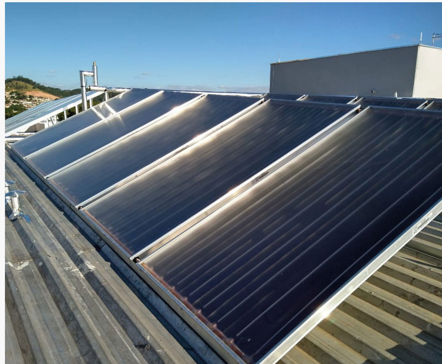
Imagem 5: Placas de captação da radiação do sol

Um bastante difundido no Brasil é o sistema termossolar que, como o nome sugere, tem como recurso a radiação captada do Sol que é absorvida pela água que circula no interior dos painéis e que posteriormente é armazenada aquecida em um reservatório.