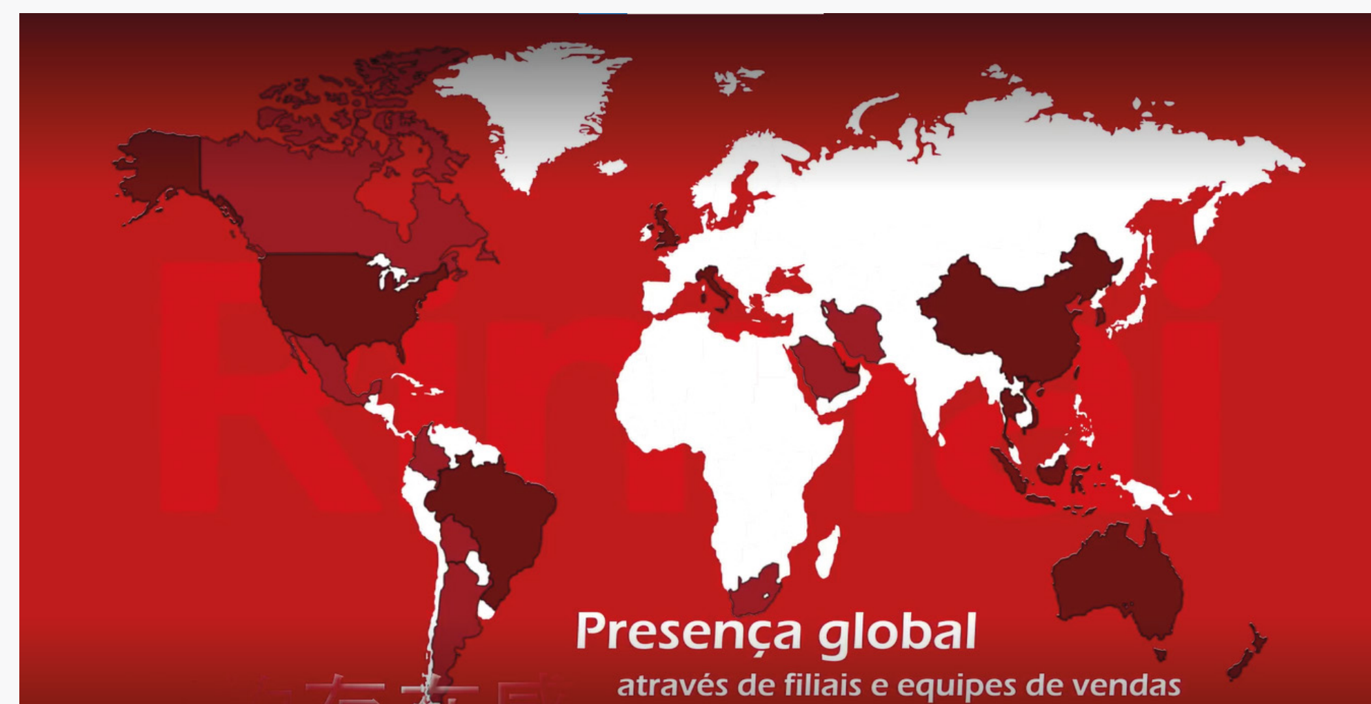
Imagem 3: Presença da Rinnai® através de filiais

No mundo, a Rinnai® se faz presente através de suas afiliadas e subsidiárias no Canadá, EUA, Itália, Reino Unido, Coreia do Sul, Malásia, Indonésia, China, Hong Kong, Taiwan, Tailândia, Vietnã, Austrália e Nova Zelândia.