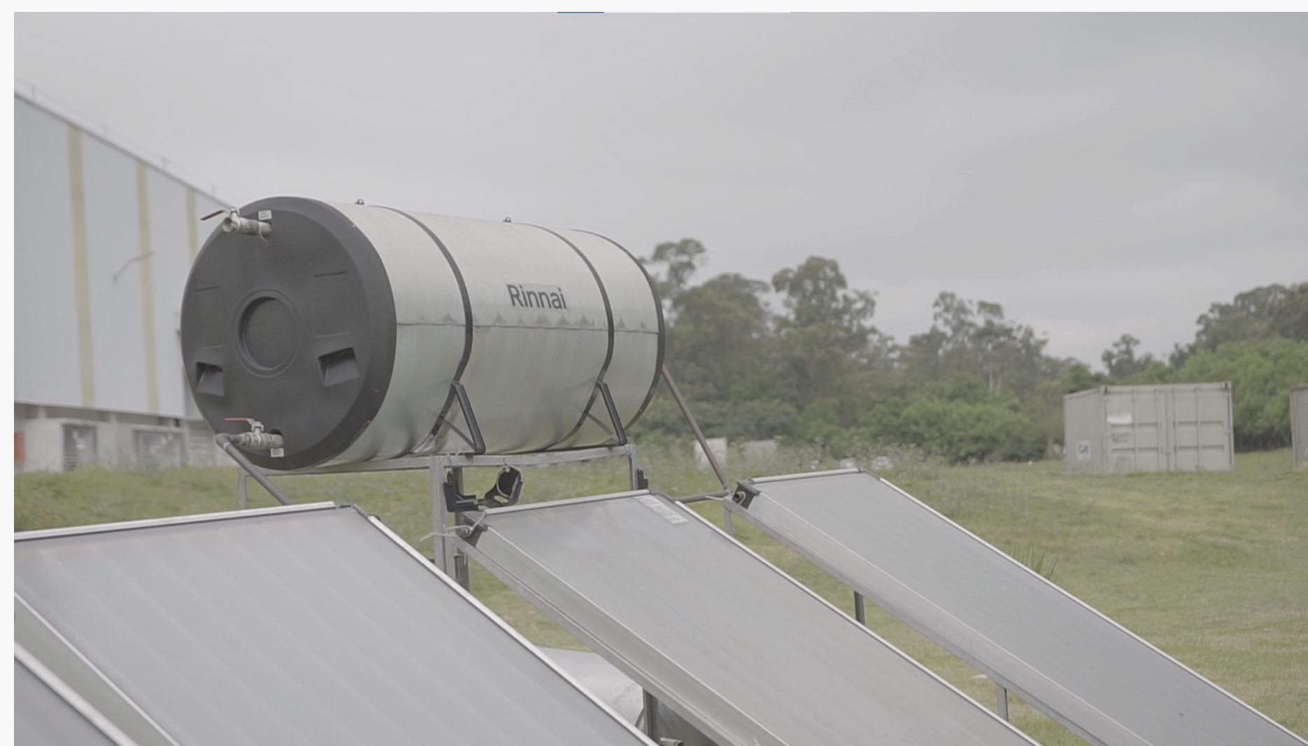
Imagem 18: Sistema de aquecimento solar

Referência normativa: requisitos para instalações de aquecimento de água solar podem ser verificados na norma ABNT NBR 15569 - Sistema de aquecimento solar de água em circuito direto - Requisitos de projeto e instalação.